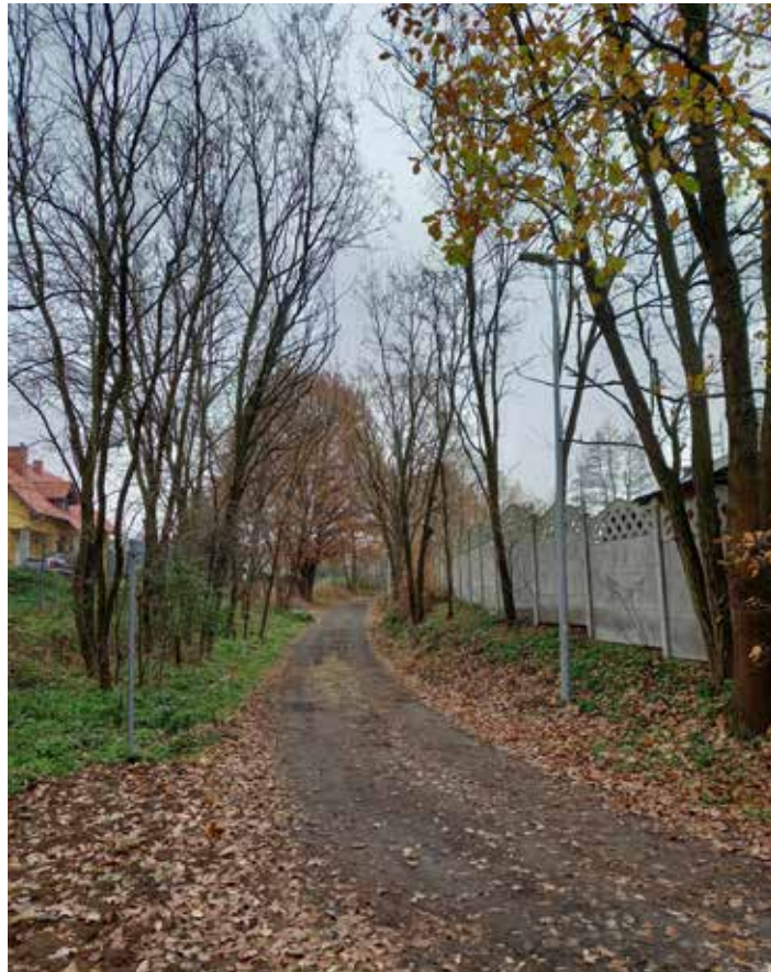
Budowa części oświetlenia ul. Czeremchowej i Spokojnej w Słonem. 55 292,52 zł, w tym 33 476,40 zł ze środków Urzędu Gminy, 15 000,00 zł z funduszu sołectwa Słonego