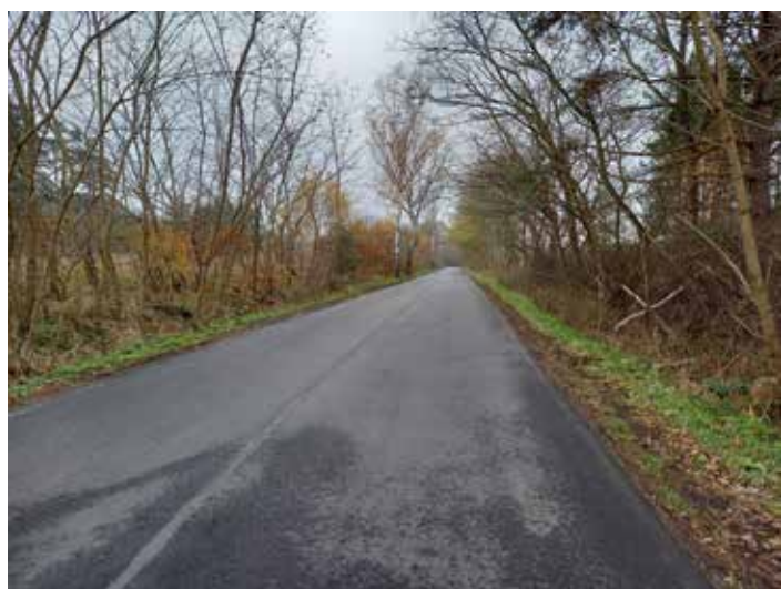
Odcinkowy remont nawierzchni drogi powiatowej relacja Słone-Buchatów. 432 000,00 zł, w tym 100 000,00 zł ze środków Urzędu Gminy, 116 000,00 zł z funduszy Powiatowego Zarządu Dróg Powiatowych, 216 000,00 zł z funduszy Nadleśnictwa Zielona Góra