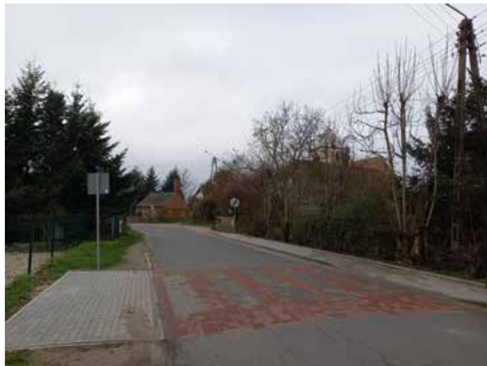
Kontynuacja budowa chodnika w Letnicy. 80 830,00 zł, w tym 20 415,00 zł ze środków Urzędu Gminy, 20 000,00 zł z funduszu sołectkiego Letnicy, 40 415,00 zł z funduszy Powiatowego Zarządu Dróg Powiatowych