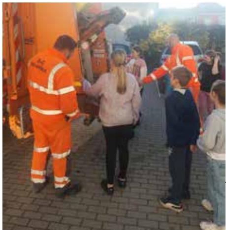
Fot. Szkoła w Świdnicy