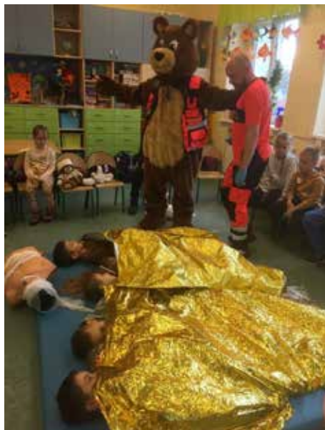
Fot. Szkoła w Świdnicy