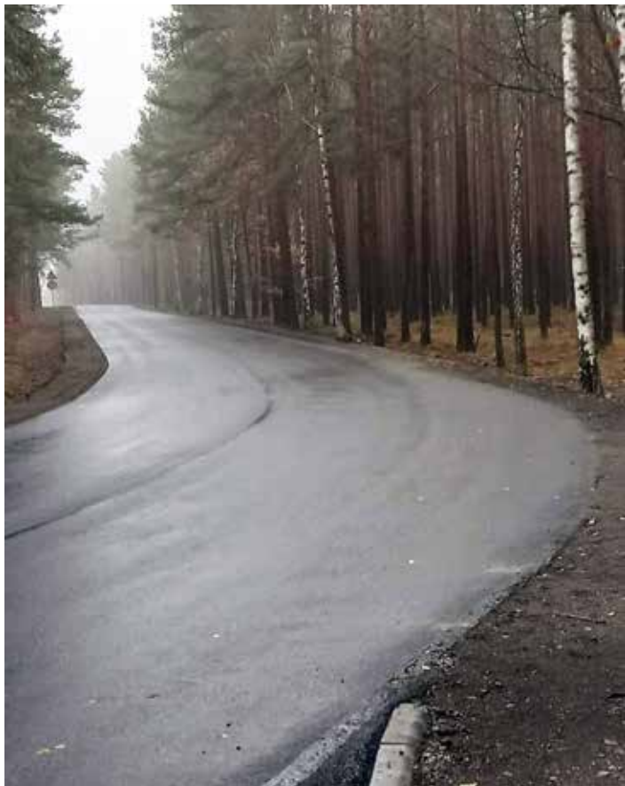
Przebudowa drogi powiatowej nr 1144F na odcinku od drogi krajowej nr 32 do drogi wojewódzkiej nr 279 w miejscowości Drzonów – etap II. Całkowita wartość zadania - 2 732 457 zł. Inwestycja zrealizowana przy wsparciu finansowym Lasów Państwowych - 2 242 000 zł, Gminy Świdnica - 250 000 zł oraz Powiatu Zielonogórskiego - 250 000 zł.