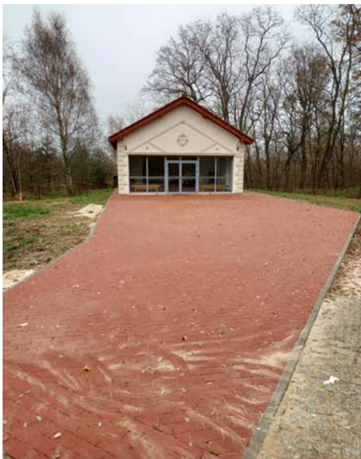
Utwardzenie terenu przed kaplicą na cmentarzu w Letnicy. 26 360,00 zł, w tym 16 360,00 zł ze środków Urzędu Gminy, 10 000,00 zł z funduszu sołectwa Letnicy