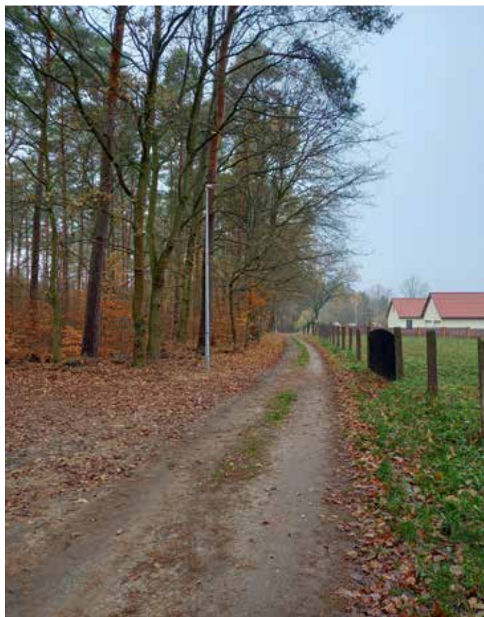
Budowa części oświetlenia ul. Ułańskiej w Słonem. 29 995,09 zł ze środków Urzędu Gminy