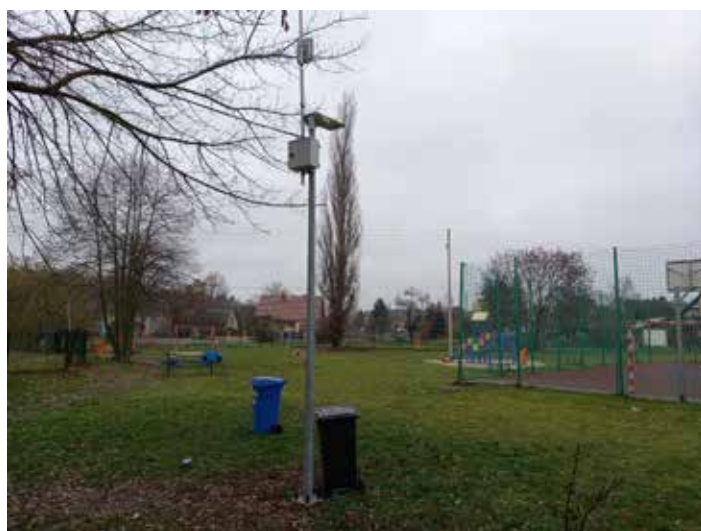
Wykonanie i podłączenie oświetlenia placu zabaw w Świdnicy 10760,78 zł ze środków Urzędu Gminy