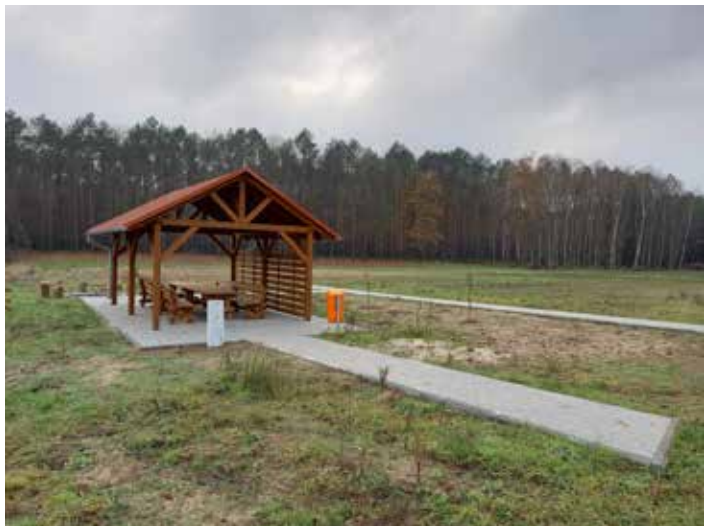
Wykonanie przyłącza elektroenergetycznego do terenu rekreacyjnego w Orzewie. 6819,12zł z funduszu sołectkiego Radomi