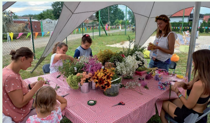
Stowarzyszenia Wyspa Kultury BazART - lokalna baza artystów i rękodzielników