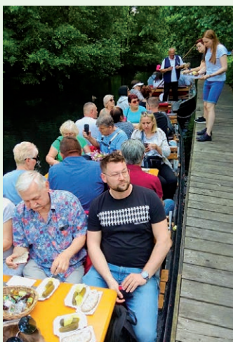
KGW Wilkanowo Wilkanowo w trasie - Spreewald