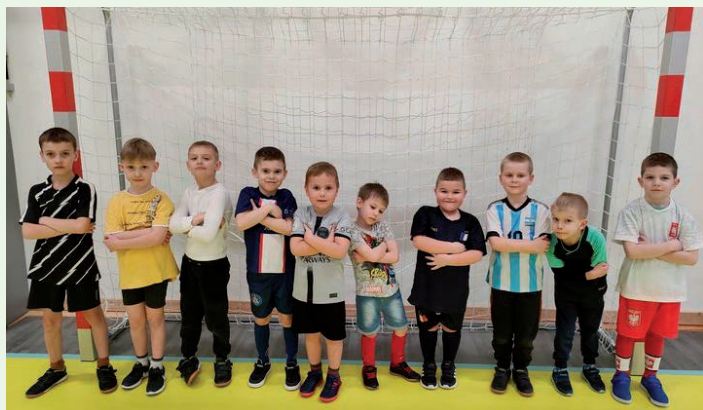
Klub Sportowy „Leśnik” Słone Szkolenie sportowe dzieci i młodzieży w piłce nożnej