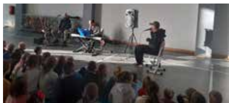
Fot. Szkoła w Stonem