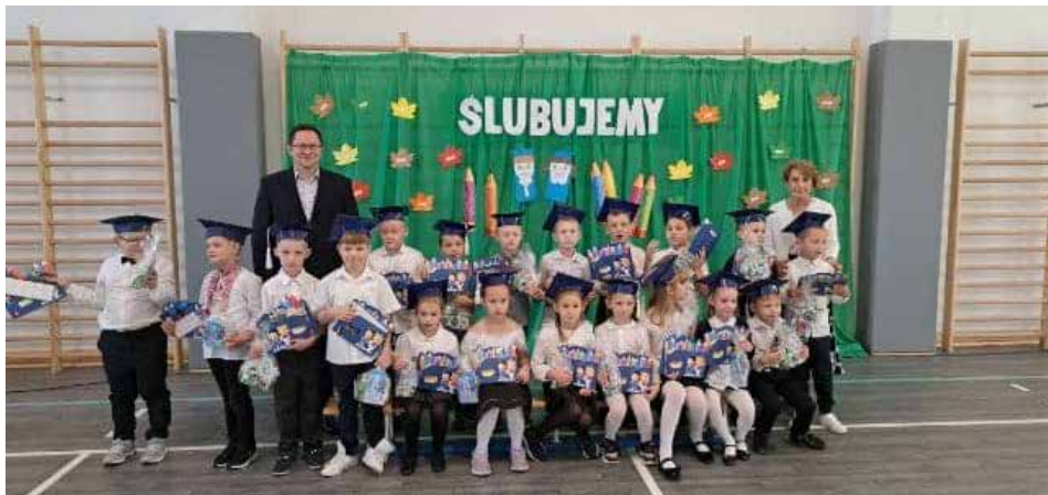
Fot. Szkoła w Stonem