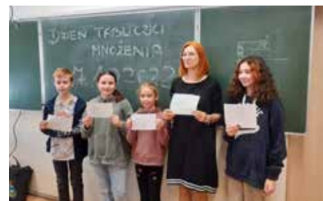
Fot. Szkoła w Stonem