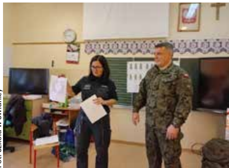
Fot. Szkoła w Świdnicy