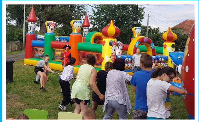
Festyn Rodzinny w Piaskach - 4 sierpnia