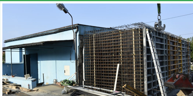
Trwa modernizacja i rozbudowa istniejącej stacji uzdatniania wody w Drzonowie.