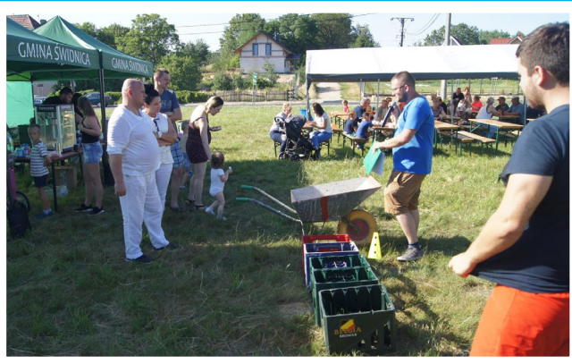
Dni Buchałowa – Turniej Rodzin – 28 czerwca