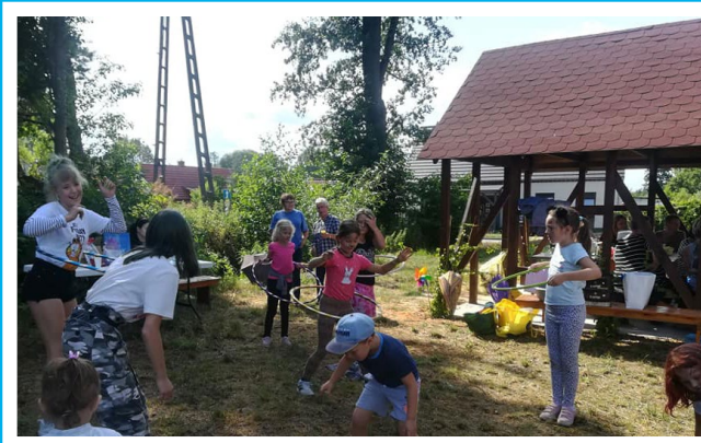
Festyn Rodzinny „Mama, Tata i Ja” – Park nad Strumieniem w Słonec – 13 lipca