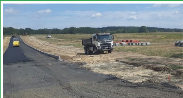
Trwają prace budowlane związane z przygotowaniem terenów inwestycyjnych pod Letnicą.

Przedmiotem zamówienia jest wykonanie dokumentacji projektowej dotyczącej budowy oświetlenia drogowego w m. Piaski od murewaną stacji transformatorowej do końca łącznika asfaltowego przecinającego się z drogą krajową nr 27.